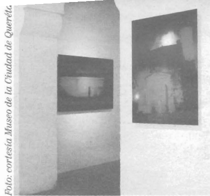
Domestic Matters de CM von Hausswloff en el Museo de la Ciudad de Querétaro.