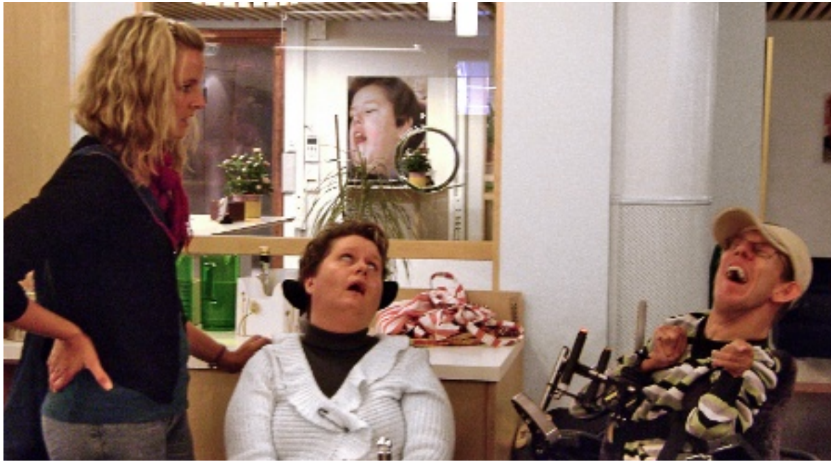
RESPALDO. Actualmente, alrededor de 15 mil personas cuentan con el apoyo de asistentes personales que ofrece el Gobierno de Suecia.

"Me convertí en asistente personal porque me gusta trabajar con la gente; soy muy sociable y creo que por