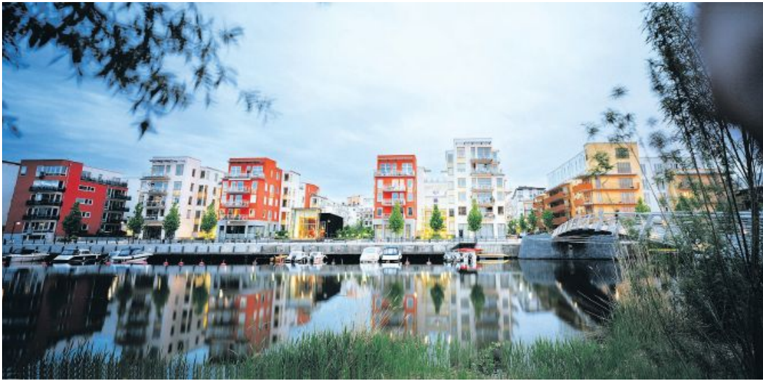
Stockholms Stadtviertel Hammarby ist weltweit ein Massstab für nachhaltiges Bauen.