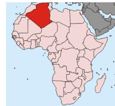
Algeriet , näst största land i Afrika

Sahara utgör 86% av Algeriets yta , svenska företag har en mycket avancerad teknik på området och har möjlighet till att bilda partnerskap för att främja förnybar energi